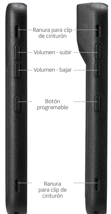
Ranura para clip de cinturón Volumen - subir Volumen - bajar Botón programable Ranura para clip de cinturón