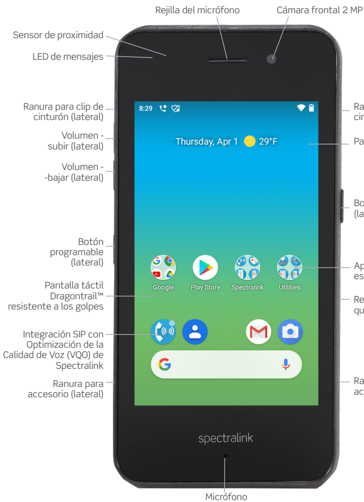
Rejilla del micrófono Cámara frontal 2 MP Sensor de proximidad LED de mensajes Ranura para clip de cinturón (lateral) Volumen - subir (lateral) Volumen - bajar (lateral) Botón programable (lateral) Pantalla táctil Dragontrail™ resistente a los golpes Integración SIP con Optimización de la Calidad de Voz (VQO) de Spectralink Ranura para accesorio (lateral) Pantalla 4", 800x480 Botón programable (lateral) App de utilidades especializada de Spectralink Resistente a los productos químicos, según estándar IP65 Ranura para accesorio (lateral) Micrófono