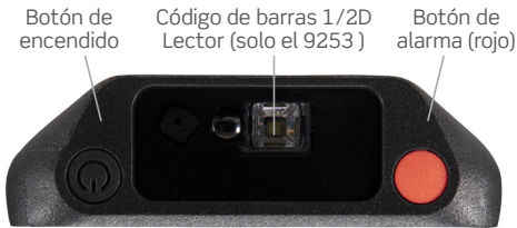
Botón de encendido Código de barras 1/2D Lector (solo el 9253) Botón de alarma (rojo)