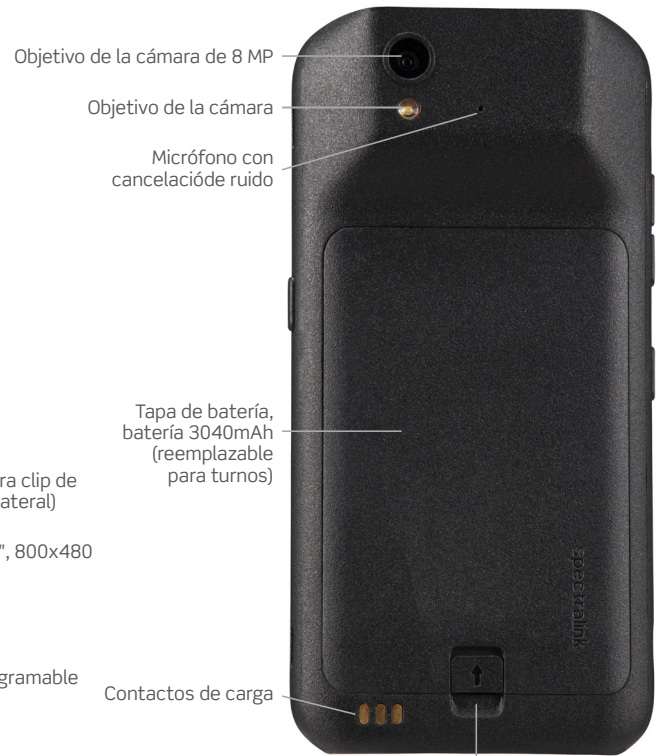
Objetivo de la cámara de 8 MP Objetivo de la cámara Micrófono con cancelación de ruido Tapa de batería, batería 3040mAh (reemplazable para turnos) Contactos de carga